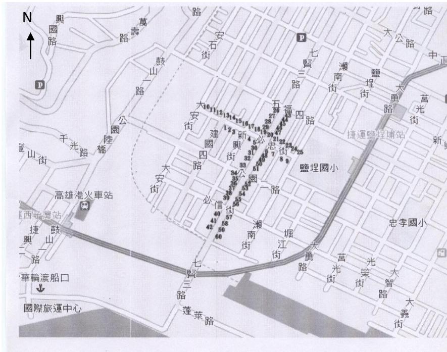
圖 2 高雄市七賢三路/必忠街菲律賓外勞商店街商業設施分佈圖